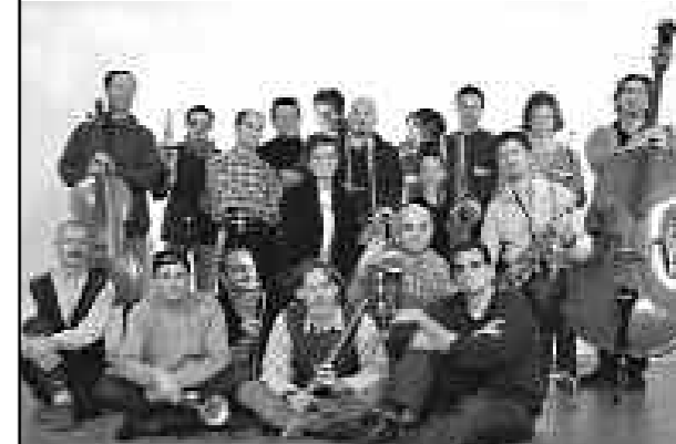
NEW PROJECT JAZZ ORCHESTRA