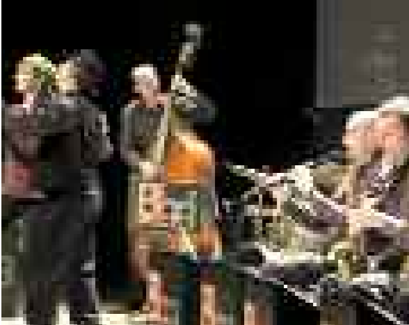
BIG BAND DE GRANOLLERS

Havana Quartet presenta el seu primer CD Capvespre al Delta en un concert basat, d'una banda, en la recerca de repertori procedent de diferents cultures i, de l'altra, en la inquietud per aprofundir i investigar a partir d'un llenguatge musical comú que és el jazzístic. El resultat és un recull de cançons eclèctic i coherent alhora: temes propis, cançons sefardites i andaluses, estàndards de jazz... Capvespre al Delta és un concert suggerent, ple de pinzellades originals... una proposta amb personalitat marcada en què es potencia els aspectes més comunicatius de la música.